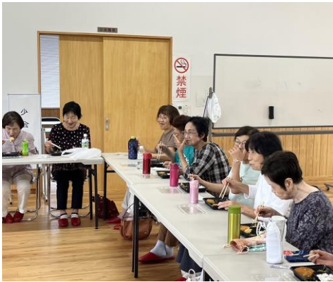
社会福祉事業【ランチクラブ(阿曾)】