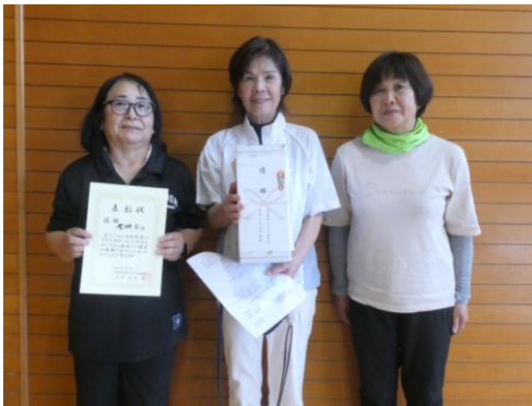
金輪Bチームの皆さま