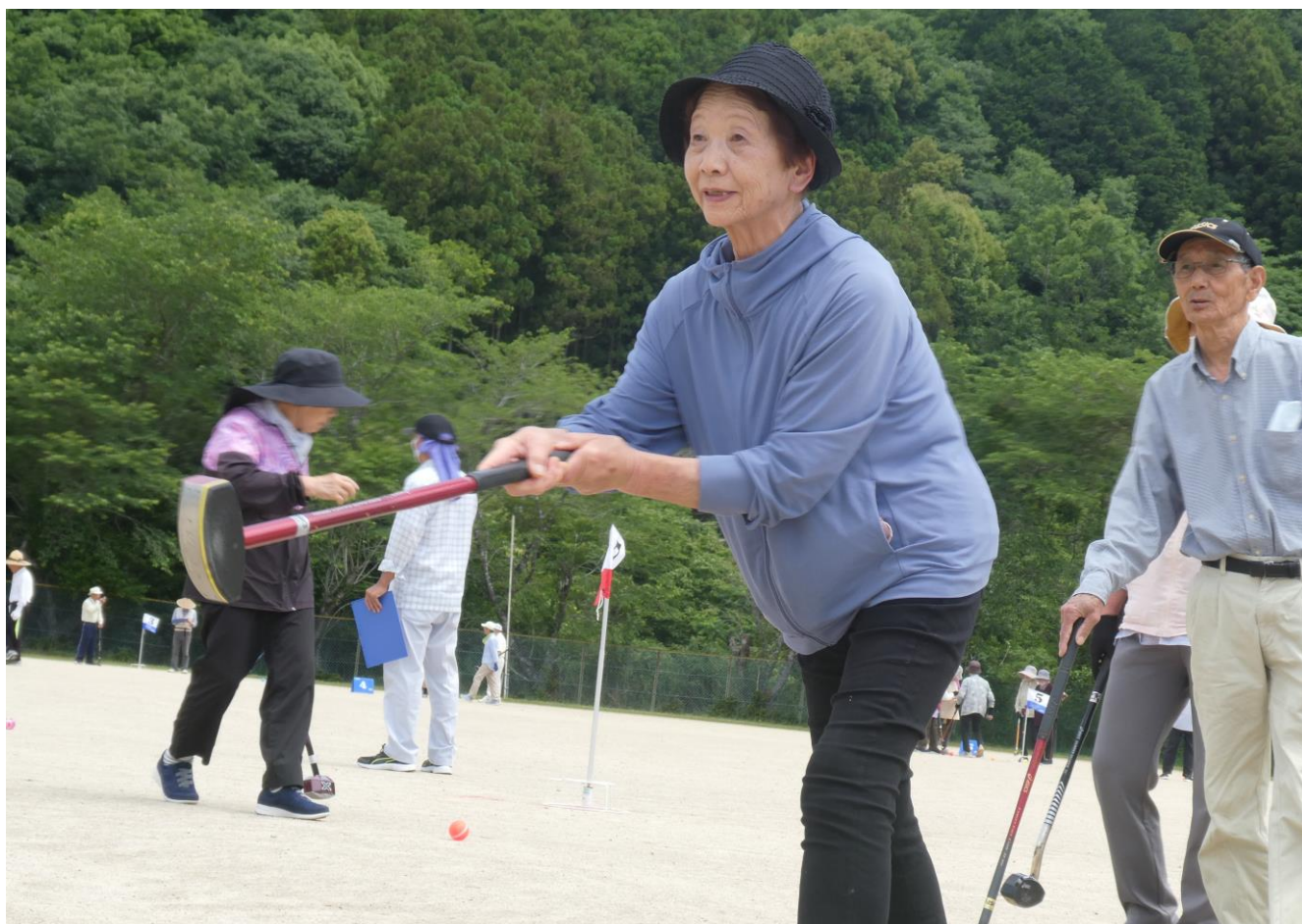
大紀町長杯グラウンドゴルフ大会の様子(関連記事 p2)