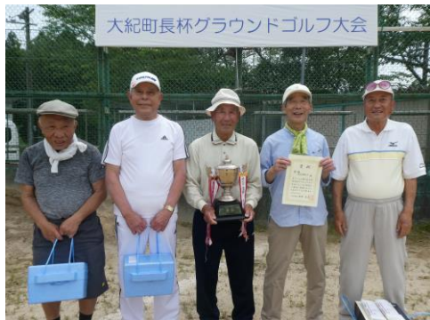
古里和老会Aチームの皆さま

老人クラブ主催、カラーリング大会を開催しました。34チーム108人が参加し、優勝は金輪Bチームの皆さまです。おめでとうございます！