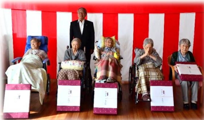
特別養護老人ホーム 共生園