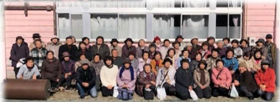
滝原地区の参加者の皆さん