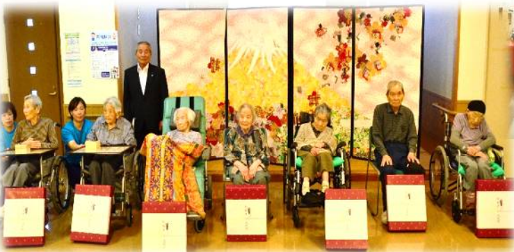
特別養護老人ホーム 大宮園