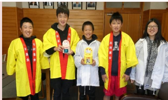
七保小学校の児童の皆さん