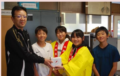
錦小学校の児童の皆さん

「赤い羽根共同募金運動」が全国で一斉に行われ、ご家庭や小・中学校、商店、施設、病院等での募金箱設置など募金活動にご協力を頂き、ありがとうございました。皆様から寄せられました募金は県内の社会福祉協議会や施設・団体等に配分され、地域福祉の推進や交流等を図るために活用されます。